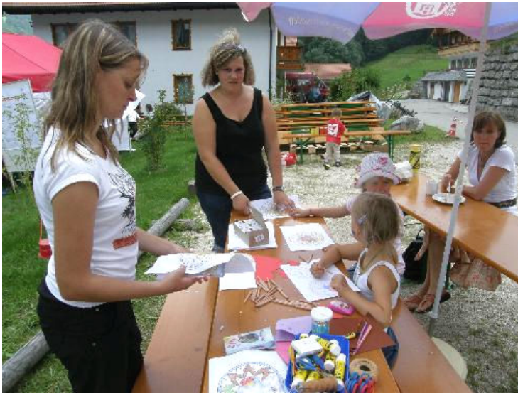
Neben Schminken und Malen für die Kleinsten gab es auch eine Tombola. Der Erlös des gesamten Festtages kommt der Erhaltung der Kirche „Zum Guten Hirten“ zugute.