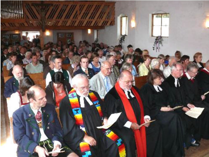
Die Festgemeinde mit Ehrengästen und vollständig versammelter evangelischer Geistlichkeit.

Festgottesdienst mit anschließendem Gemeindefest am 27. Juli 2008