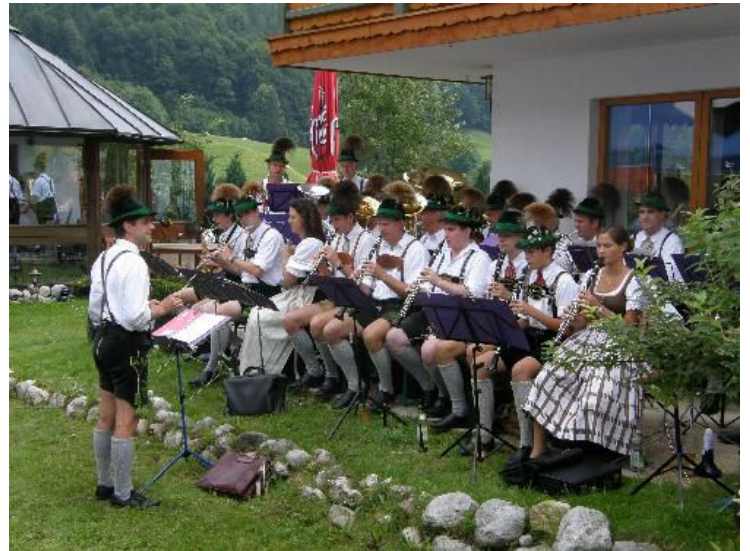
Ein musikalisches und optisches Highlight: Die Trachtenblaskapelle Ramsau sorgte für die zünftige Umrahmung des Gemeindefests.