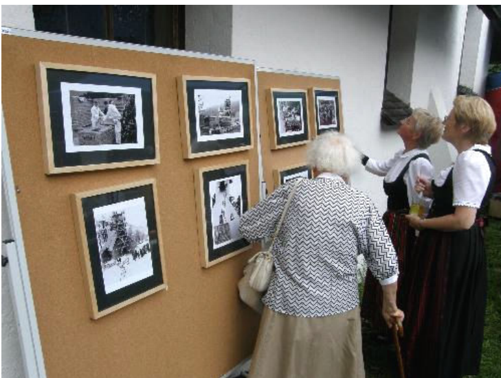
Auf einer Schautafel konnten historische Aufnahmen vom Bau und der Einweihung der evangelischen Kirche betrachtet werden.