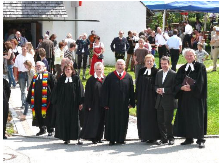
Die evangelische Geistlichkeit präsentiert sich nach dem Auszug den Fotografen.