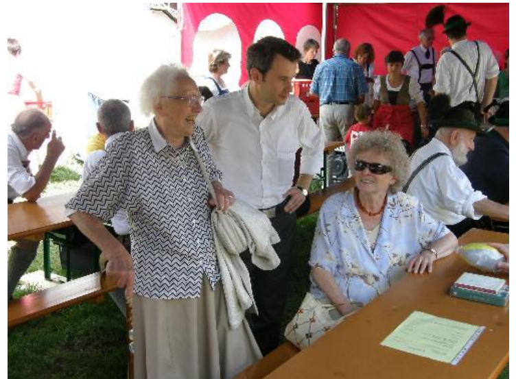
Festgast war auch eine 87-jährige Touristin aus Berlin, die bei der Einweihungsfeier vor 50 Jahren anwesend war und seitdem über 50 mal Urlaub in der Ramsau gemacht hat.