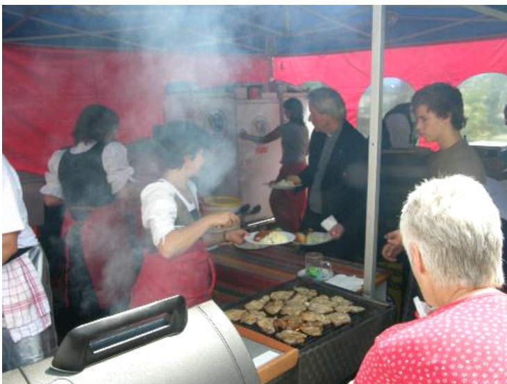
Viele fleißige Helferinnen und Helfer sorgten dafür, dass alle Gäste satt wurden, zuerst mit Gegrilltem und Salaten, später mit Kaffee und Kuchen.