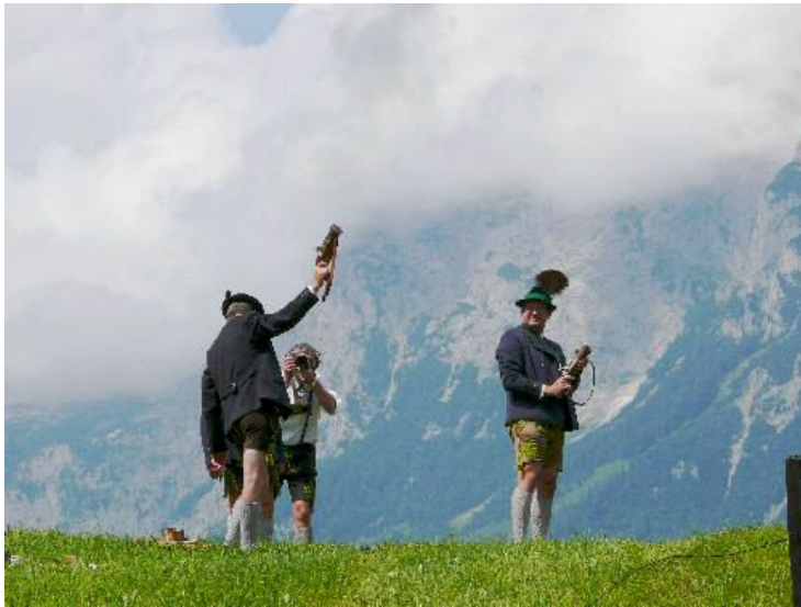
Die Ramsauer Weihnachtsschützen begleiteten vor der herrlichen Kulisse der Ramsauer Berge den Auszug der Festgemeinschaft mit ihren Böllerschüssen und leiteten zum Gemeindefest über.